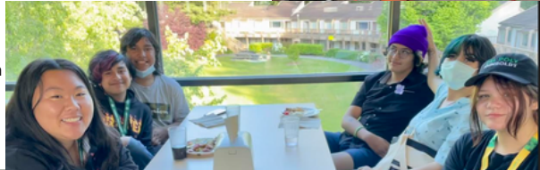
Sixth-grade FUTURE COLLEGE GRADUATES from Crescent Elk enjoy a College Knowledge Scavenger Hunt, and incoming 9th graders from Del Norte, Humboldt, and Fort Bragg experience college campus life at the Student Recreation Center and Humboldt Dining as part of the High School Readiness Retreat at Cal Poly Humboldt.