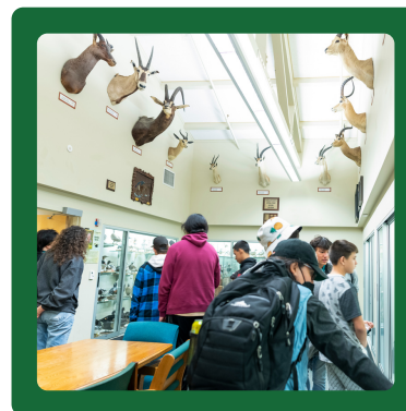
Students from Hoopa Valley and Trinity Valley elementary schools, exploring the Wildlife and Fisheries building "Bird Room"